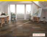
BAU & ENDO

De carácter moderado se destaca por su versatilidad en todas las zonas donde exista un producto con muchas opciones que tengan la versatilidad del espacio de la oficina.