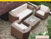
SOFA & SILLAS

Detalle inspirado en la combinación de tonos minerales que aporta una sensación rústica y una sofisticada personalidad a los espacios exteriores.